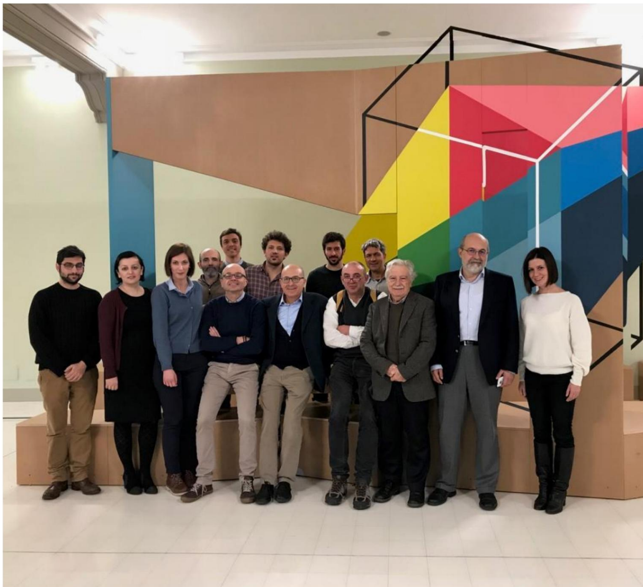
Séminaire «Riabitare l'Italia» Collège Carlo Alberto Turin, 17 décembre 2017